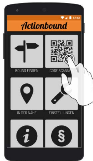
QR-Code mit der Actionbound-App scannen

Ziel ist es bei diesen Touren möglichst viele Punkte zu sammeln.